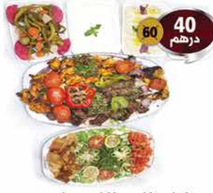
كيلو مشاوي مشكل مع عرايس والمقبلات