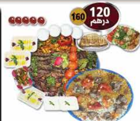
صينية مشاوي مشاكل 2 كيلو مع صينية رز مشكل لحم ودجاج مع المقبلات