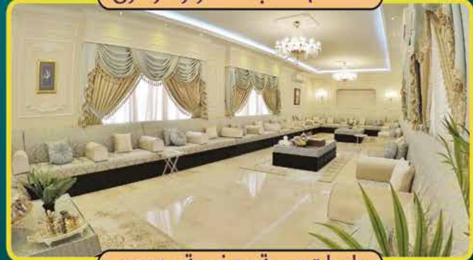
جلسات عربية ومغربية ومودرن