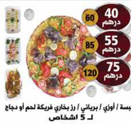
كبسة / أوزي / برياني / رز بخاري فريكة لحم أو دجاج لـ 5 اشخاص لـ 8 اشخاص لـ 10 اشخاص