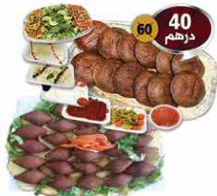
كيلو كبة (مشوي، أو مقلي) مع المقبلات