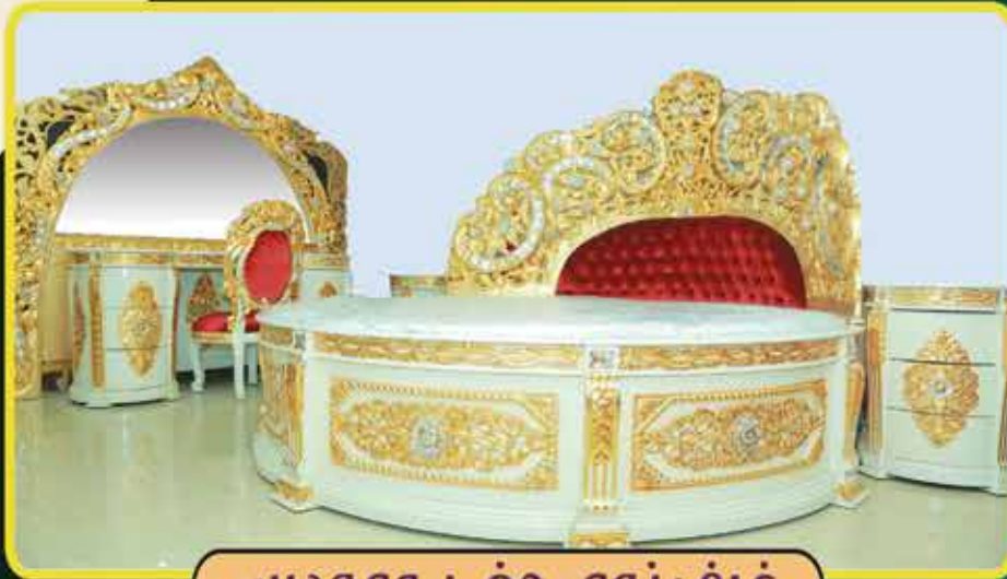
غرف نوم حفر ومودرن

عروض رمضان الكبرى خصم يصل من 20% الى 50% على جميع البضائع