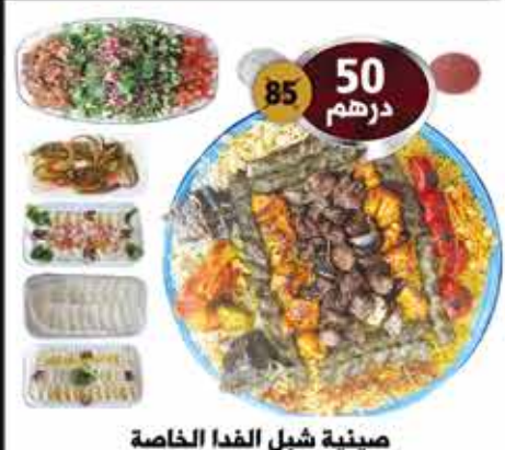
صينية شبل الفدا الخاصة مشاوي مشكل + لحم ودجاج