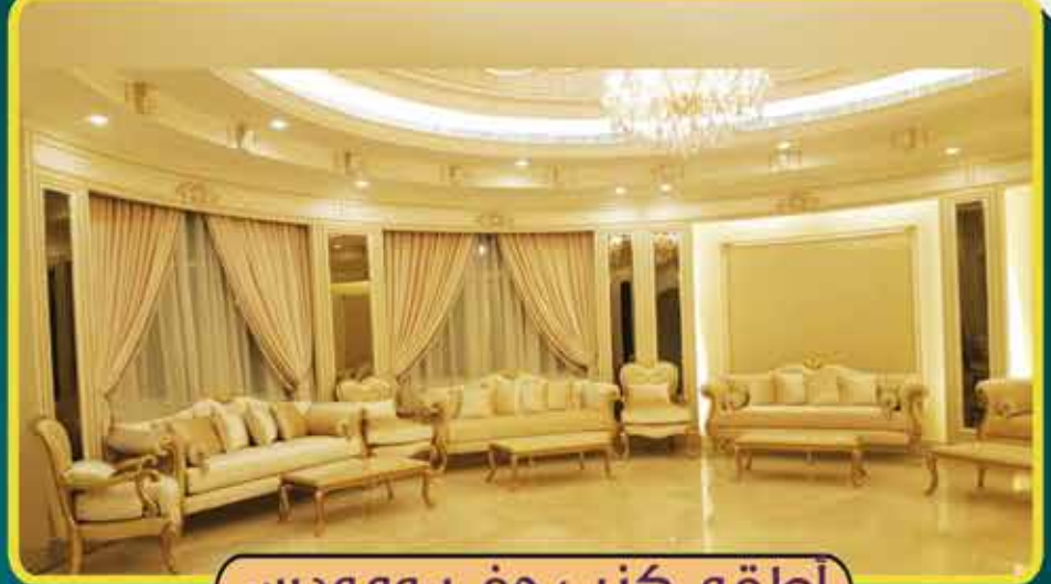
أطقم كنب حفر ومودرن