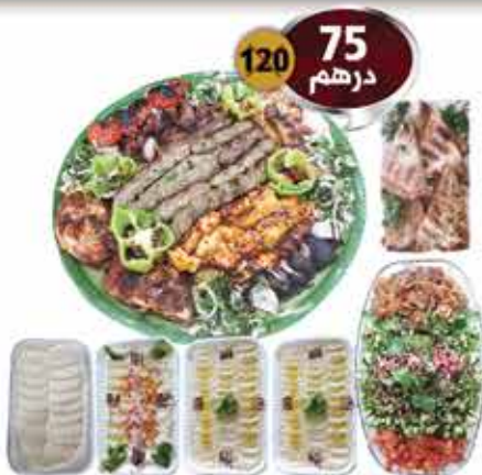
صينية مشاوي مشكل 3 كيلو مع المقبلات