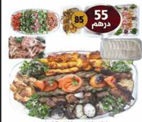
جات مشاوي مشكل 2 كيلو مع المقبلات