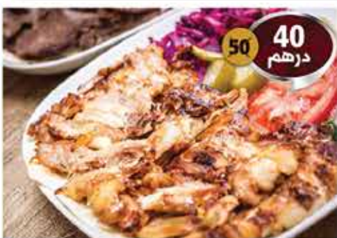
خمس اشخاص شاورما مع المقبلات