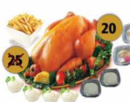
فروج مشوي ماكينة / رز وبطاطا كامل مع المقبلات / 2 مخلل - 2 حمص - 4 ثوم