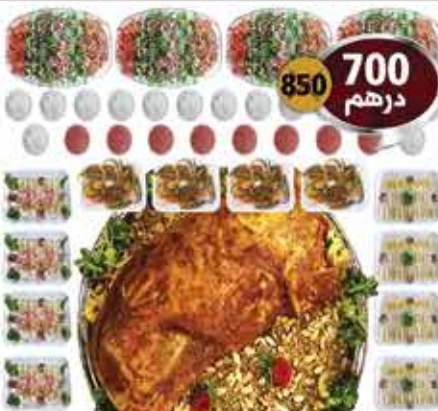
خروف محشي مع المقبلات