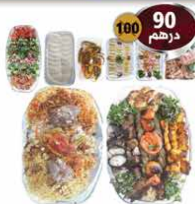
رز مشكل لحم ودجاج مع جات رز مشكل لحم ودجاج مع المقبلات